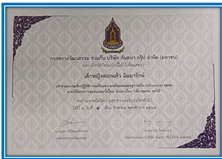
ข้าพเจ้าเป็นผู้ส่งเสริม การเข้าร่วมโครงการชุมชนแชมป์เปียน นักเล่าเรื่อง “เที่ยวชุมชน ยลวิถี” ได้รับรางวัลระดับจังหวัดฉะเชิงเทรา ผ่านเข้ารอบระดับประเทศ จัดโดย สำนักงานวัฒนธรรมจังหวัด ฉะเชิงเทรา